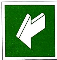
Ciągnąć, aby otworzyć