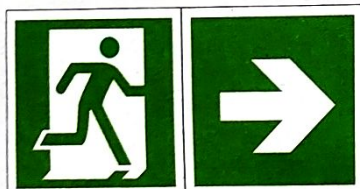
Kierunek do wyjścia ewakuacyjnego - w prawo