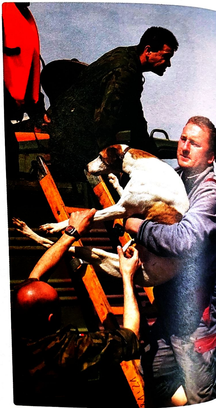
Ewakuacja zwierząt w czasie powodzi

W rejonach zagrożonych lub zniszczonych na skutek katastrofy ochronę dobytku ewakuowanej ludności przejmują policja, wojsko oraz inne służby i instytucje wyznaczone przez władze. Zagrożenie działaniami wojennymi może oznaczać zniszczenie albo utratę mienia osób ewakuowanych.