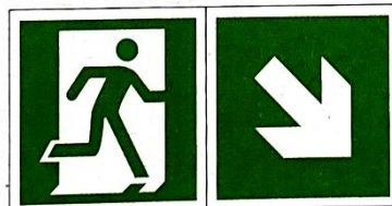
Kierunek do wyjścia ewakuacyjnego - w dół w prawo