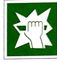
Stłuc, aby uzyskać dostęp