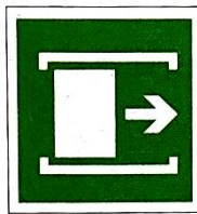
Przesunąć w celu otwarcia