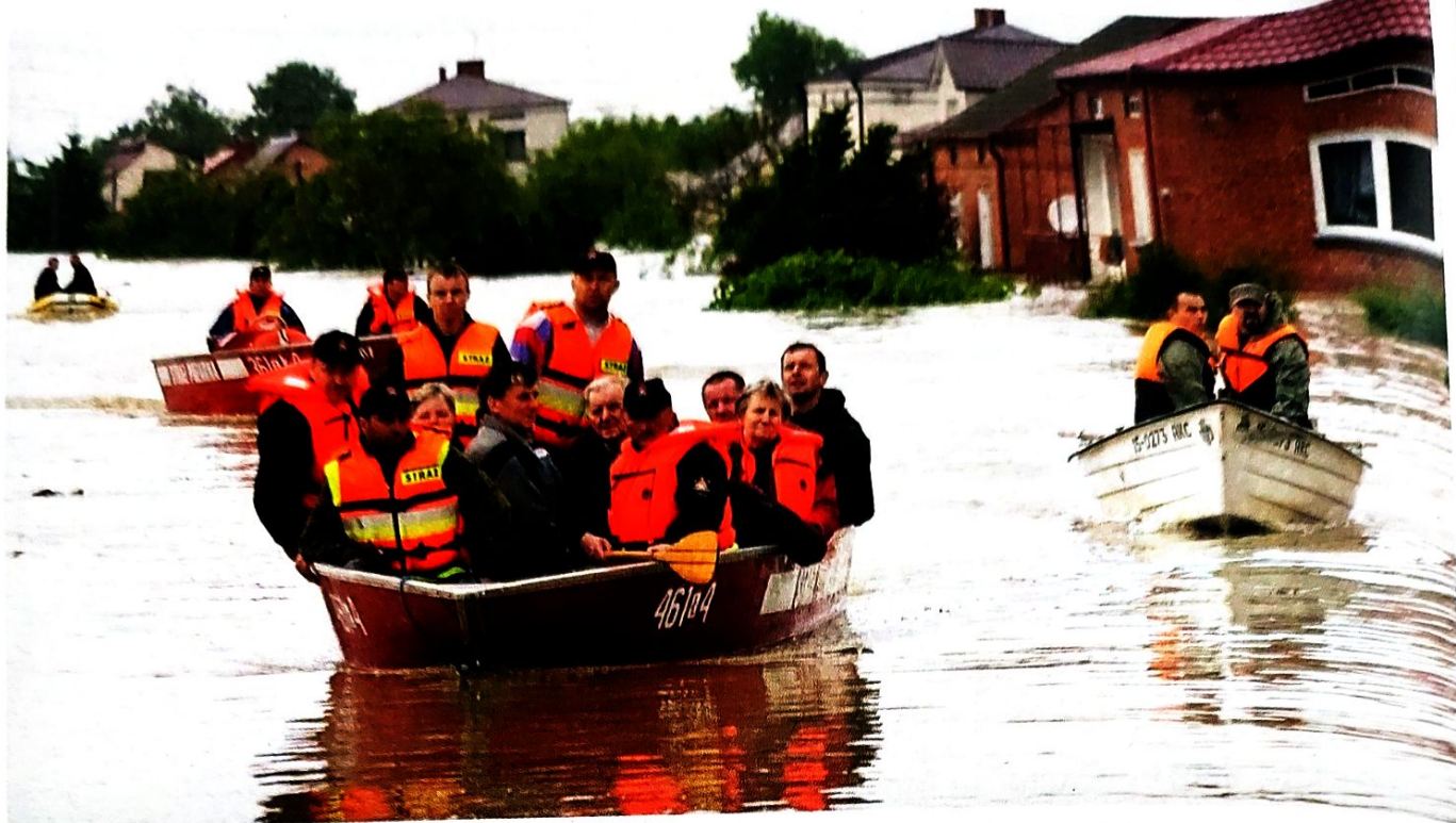
Wspólna akcja wojska, straży pożarnej i WOPR podczas ewakuacji ludności z powodzi