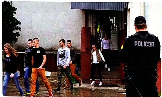
Próbna ewakuacja ze szkoły

Ewakuacji podlegają wszystkie osoby, które znajdują się w rejonie zagrożenia, jednak pierwszeństwo przysługuje : matkom i dzieciom, kobietom ciężarnym, osobom niepełnosprawnym, osobom przebywającym w zakładach opiekuńczych, szpitalach, podopiecznym opieki społecznej itp.