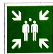
Miejsce zbiórki do ewakuacji