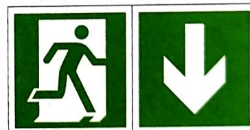
Kierunek do wyjścia ewakuacyjnego - w dół (prawostronny)